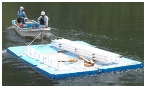
資機材の水上曳航